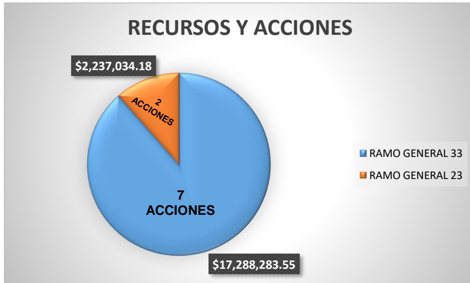
Ilustración 3. Presupuesto Total ejercido por el Pp K004.- Electrificación.